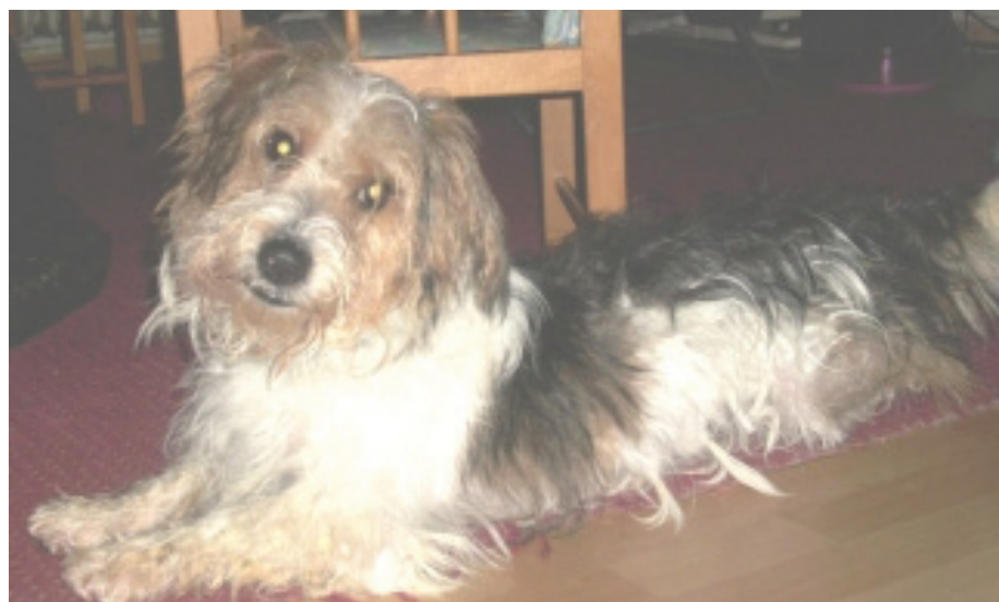
Berni en Alemania ( www.sos-vitoria.org/.../hunde-noch-in-spanien/ Consultado el 19.04.10)