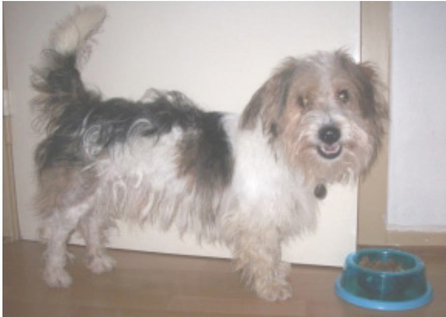
Berni en Alemania ( www.sos-vitoria.org/.../hunde-noch-in-spanien/ Consultado el 19.04.10)

pie de foto se ofrece a aquellas personas que puedan interesarse en alguno de los dos animales un contacto telefónico, fax, e-mail con la persona responsable del lugar; en algunos casos se especifica incluso el precio del animal: Andia y Ruma, por ejemplo cuestan 240 €, en la ficha de Pitxi se lee que se vende en refugio de animales Dillenburg. No existe ninguna duda de que la foto sola puede inducir a la gente a pensar indistintamente que Berni y Kayla ya están adoptados o que esperan ser adoptados, depende del texto que acompañe a la imagen.