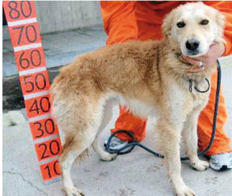
Jibaro en Vitoria ( www.sos-vitoria.org/.../hunde-noch-in-spanien/ Consultado el 19.04.10)