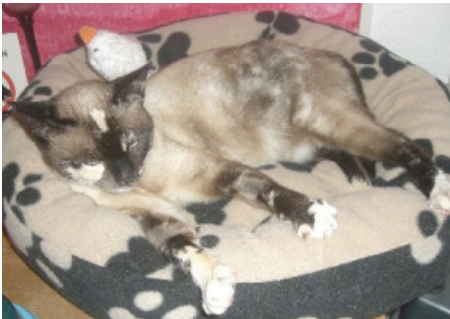
Duquesa / Kayla en Alemania ( www.sos-vitoria.org/.../hunde-noch-in-spanien/ Consultado el 19.04.10)