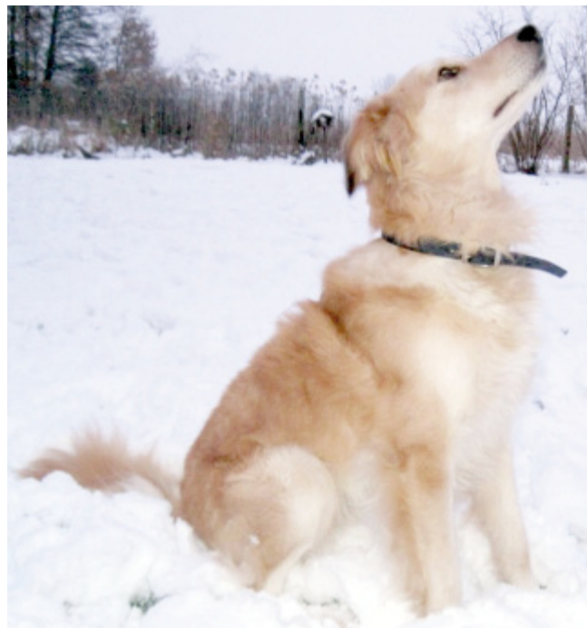
Jibaro en Alemania ( www.sos-vitoria.org/.../hunde-noch-in-spanien/ Consultado el 19.04.10)