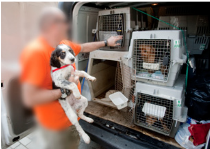
CARLOS GARCÍA, fotógrafo.

En el Diario El Mundo (10.09.09), el fotógrafo Carlos García Pozo, que capta el mismo instante que sus colegas, logra mostrar a la opinión pública el auténtico documento de las terribles condiciones en que se hace viajar a estos pobres animales. Las altas temperaturas, el día que se realiza el transporte de los animales se superan los 25°, animales hacinados en furgonetas sin aire acondicionado y herméticamente cerrados emprenden un viaje cuya duración, hasta el primer destino y según los organizadores, es como mínimo de 16 horas El incumplimiento de la normativa europea en materia de transporte animal es, a nuestro juicio, sangrante. Si a esto unimos que en esta expedición también iban gatos, sobran comentarios: