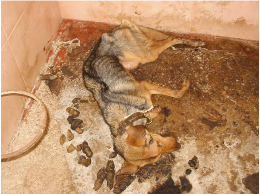
Cadáver rodeado de excrementos