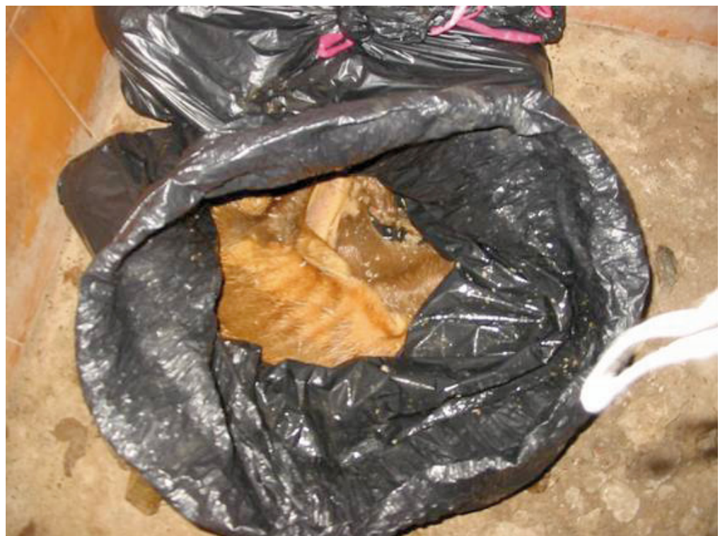
Bolsa cadáver abierta