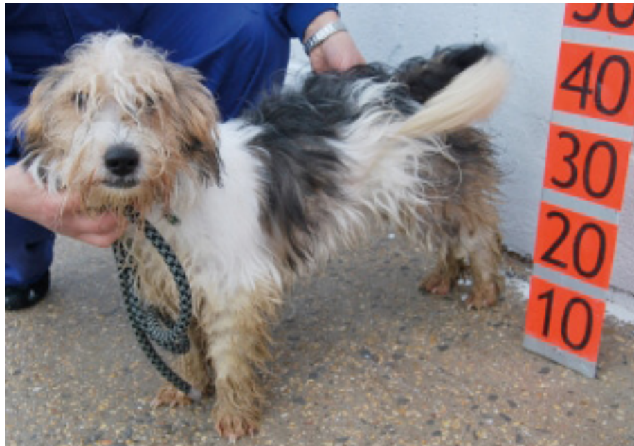
Berni en Vitoria ( www.sos-vitoria.org/.../hunde-noch-in-spanien/ Consultado el 19.04.10)

El contraste entre la satisfacción y sensación de bienestar que causan las imágenes de Berni, Duquesa y Jibaro en Alemania frente a los sentimientos que provocan las imágenes de Berni y Jibaro en Vitoria es suficiente para que muchas personas no necesiten más pruebas del destino de los animales. En otras protectoras se utiliza mucho el recurso de antes/después..., poesías y cartas escritas por el animal... Todo esto puede ser muy tierno y entrañable, pero la administración y los protectores tienen la obligación de tener, además, otro tipo de pruebas, que sean fidedignas de los nuevos destinos.